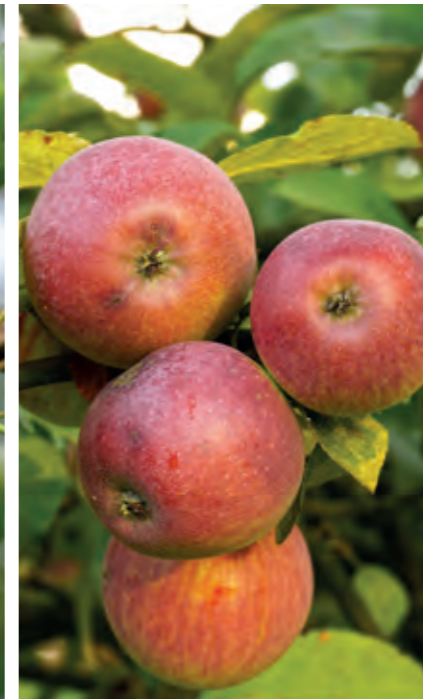
Æble Malus 'Rød Ingrid Marie' er et klassisk mad- og spiseæble, der bliver helt mørkerødt, når æblerne får godt med sol. De meget velsmagende æbler modner i september.