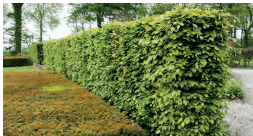
Bøg Fagus sylvatica danner den klassiske, smukke bøgehæk, der skifter udtryk med årstiderne. Om foråret er den lysegrøn, om sommeren mørkegrøn og i vinterhalvåret rødbrun. Plant 4 planter pr. løbende meter.

'En smuk hæk skaber rum og giver haven karakter'