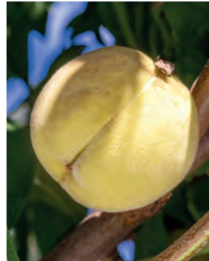
Dværgfersken Prunus persica 'Ice Peach' er en spektakulær sort, der sætter hvide frugter med sødt og saftigt, hvidt frugtkød. Den selvbestøvende sort bliver knapt 2 m høj og egner sig også til krukker.