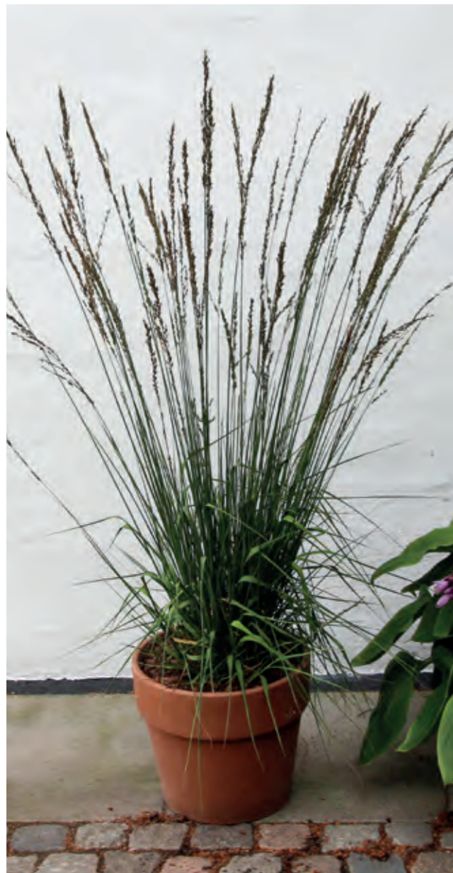
Pibegræs Molinia caerulea 'Black Arrows' er et superflot og meget karakteristisk prydragræs med en opret tue af smalle blade og markante sorte aks på næsten 2 m høje stængler fra august til oktober.

Nogle er endda helt afhængige af bestemte arter eksempelvis for at kunne opfostre deres larver. Plant derfor et godt udvalg af både stauder, træer og buske, der blomstrer på forskellige årstider, sætter spiselige frø eller frugter. Husk, at gemmesteder skabt af de flerårige planter, er lige så vigtige som føde, når naturen flytter ind i haven og hjælper til med at skabe en naturlig balance.