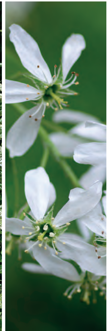
Aksbærmisspel Amelanchier spicata er en dejlig tæt busk med opret vækst, der blomstrer i det allertidligste forår samtidig med løvspring med fine, små hvide blomster i oprette stande. Purpurfarvede, blådduggede bær til fuglene.