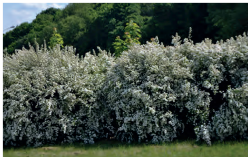
Spiraea Spiraea x vanhouttei er et oplagt valg til en stærk og hårdfør uklippet hæk, der blot skal justeres lidt i væksten. Blomstrer i maj med små, hvide blomster i skærme på graciøst buede grene. Plant 4 planter pr. løbende meter.

Hvis du planter barrodede planter, altså planter der ikke har jord omkring rødderne som for eksempel hækplanter og mange roser, er det helt nødvendigt at vente med at plante, til vækstsæsonen er forbi, og planterne har tabt bladene. Det begrænser nemlig den skånselsløse fordampning og sikrer, at rødderne kan bruge deres kræfter på at etablere sig i jorden, så de er klar, når næste vækstsæson begynder.