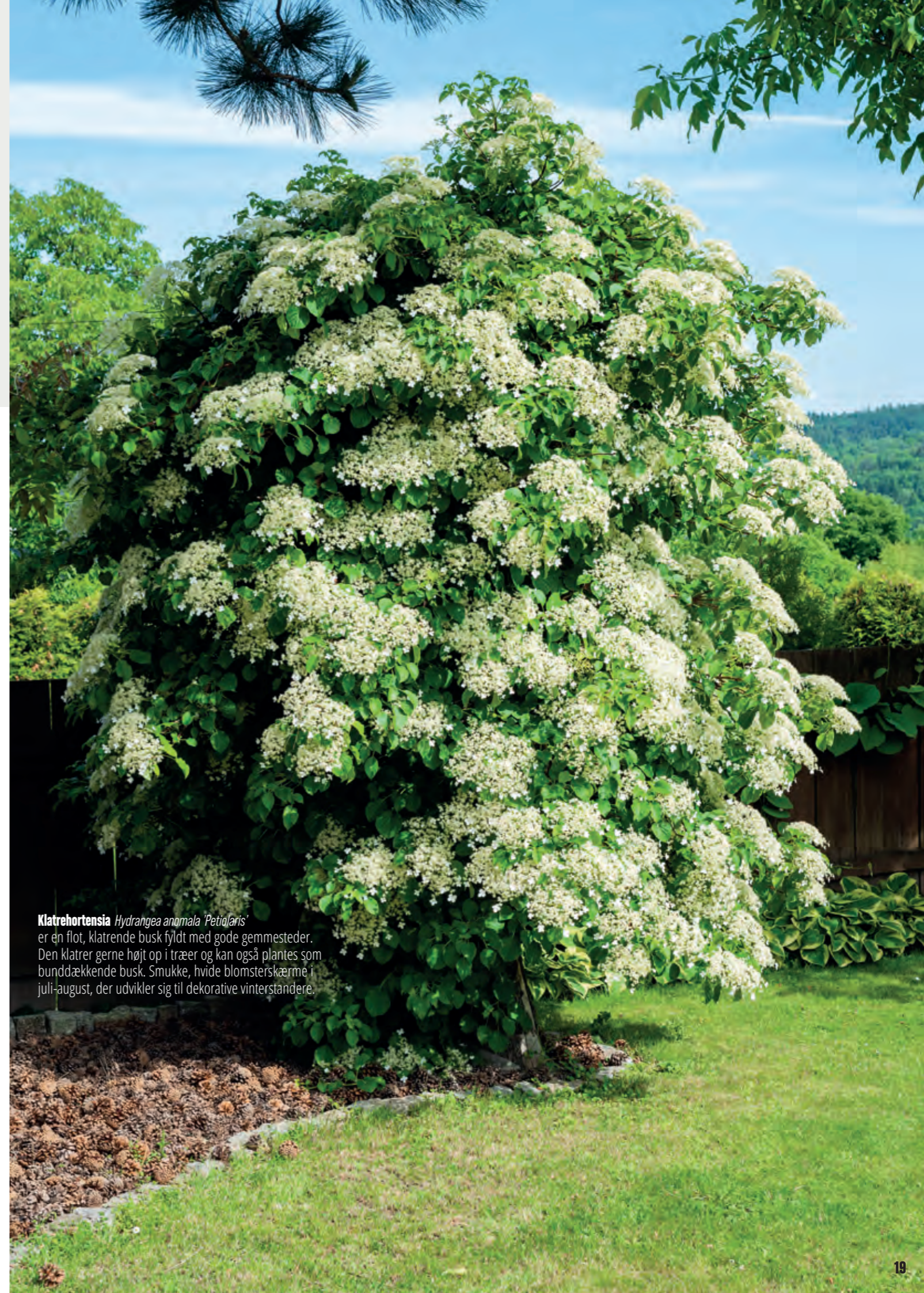
Klatrehortensia Hydrangea anomala 'Petiolaris' er en flot, klatrende busk fyldt med gode gemmesteder. Den klatrer gerne højt op i træer og kan også plantes som bunddækkende busk. Smukke, hvide blomsterskærme i juli-august, der udvikler sig til dekorative vinterstandere.