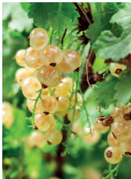
Hvid ribs Ribes rubrum 'Hvid Hollandsk' er en ganske særlig sort af ribs, der ikke får røde men gulligt hvide bær med god sødme. Klaserne høstes i begyndelsen af juli. Trives bedst i masser af sol.