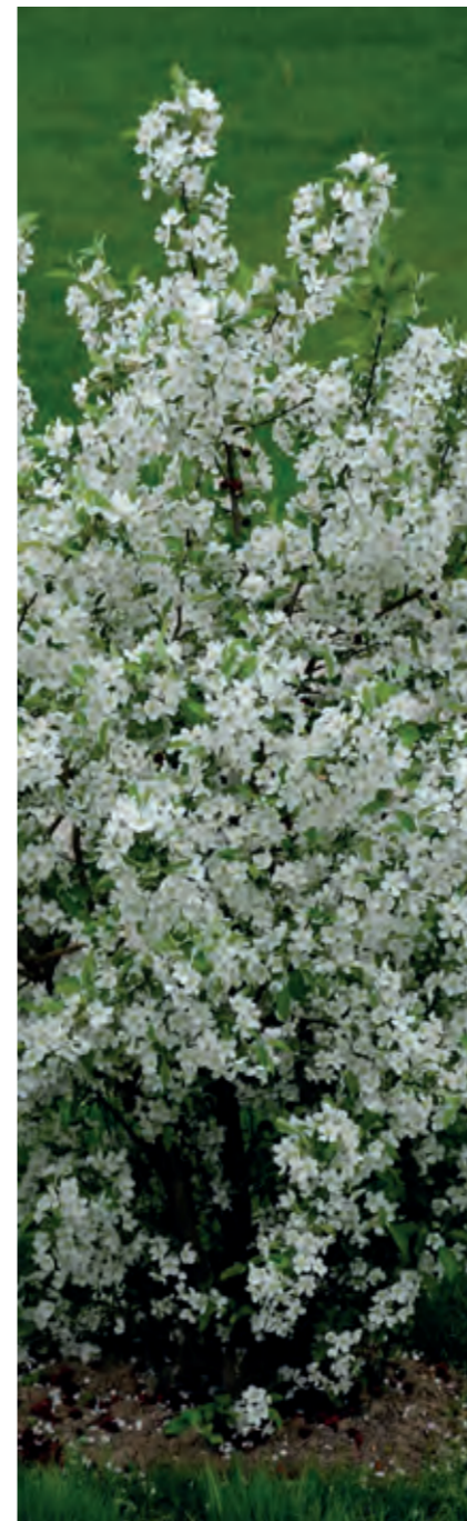
Sargentsæble Malus sargentii er en smuk og stærk busk, der både egner sig som uklippet hæk og som fritstående. Blomstrer helt overdådigt i maj-juni og får derefter fine, lakrøde bær, som fuglene er vilde med.

Vand i haven er samtidig noget af det bedste, du kan gøre for de fjerdede venner. De har mindst lige så meget brug for at kunne drikke som for at kunne finde føde. Derfor er det en rigtig god ide at stille fyldte fuglebade til rådighed. Det er faktisk også en god ide at hænge redekasser op allerede i efteråret, for i en snæver vending er de også guld værd, når det er nødvendigt at søge ly.