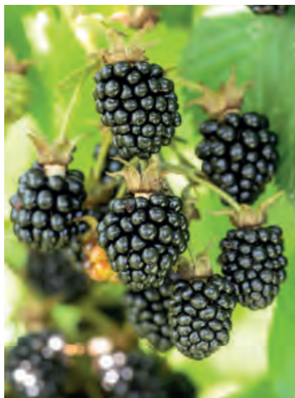
Brombær Rubus fruticosus 'Black Satin' er en kraftigt-voksende sort, med mange, lange og heldigvis tornfri skud. Giver et stort udbytte af store, faste og velsmagende bær i september-oktober.

Stil planterne i en balje vand, så de kan suge til sig, mens du graver et godt, stort hul på en solbeskinnet plet i haven. Tag så planten ud af potten og løsn eventuelt rødderne lidt, hvis de er meget sammenfiltrede. Sæt planten ned i hullet, så overfladen af potteklumpen flugter jordoverfladen og fyld så hullet to tredjedele op med jord. Hæld en kande vand i hullet, før du fylder resten af jorden i. Så kommer din nye plante godt fra start.