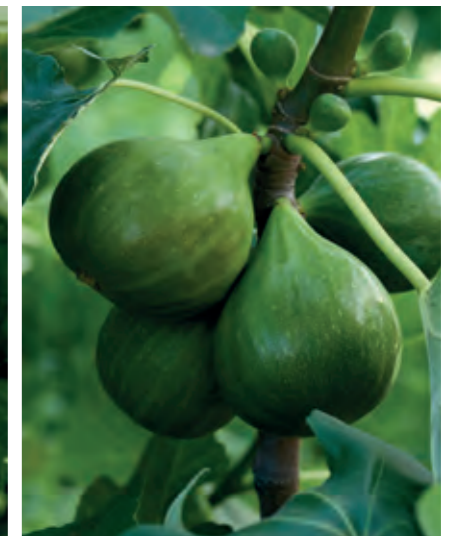
Figen Ficus carica 'Røsnæs' er en dansk udvalgt sort af figen, der udmærker sig ved sin hårdførhed i det danske klima. Desuden giver den et stort udbytte af velsmagende frugter.