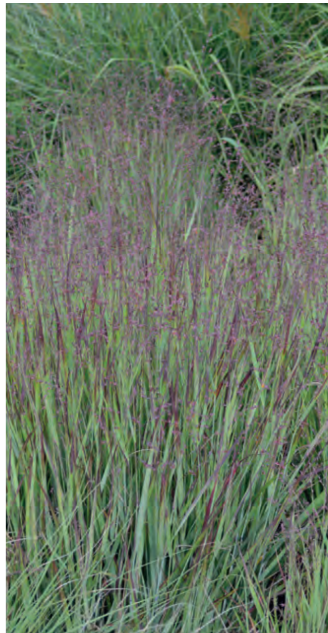
Staudehirse Panicum virgatum 'Heavy Metal' er et let og graciøst prydragræs med lette skyer af rødbrune aks, der løfter sig højt over den knapt 1 m høje tue fra juli til september.