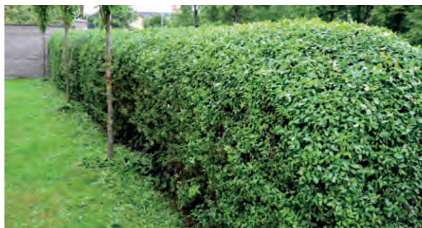
Liguster Ligustrum vulgare 'Liga' er et sikkert valg, hvis du drømmer om en tæt grøn hæk som rammen om din have. Sorten er næsten stedsegrøn, og planterne forgrener sig godt. Plant 4 planter pr. løbende meter.