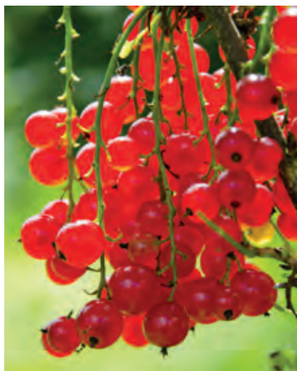
Ribs Ribes rubrum 'Rød Hollandsk' er den helt klassiske ribs, der giver et stort udbytte af skinnende lakrøde bær i kønne klaser fra begyndelsen af juli. En solrig placering giver flest bær.