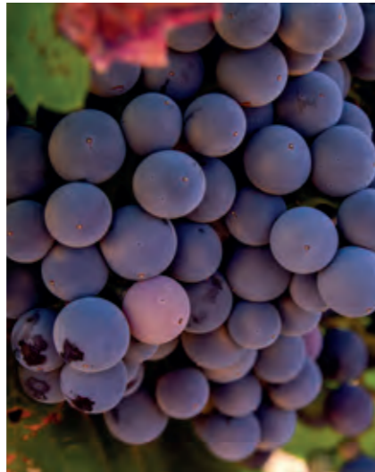
Vin Vitis vinifera 'Einset' er en hårdfør sort, der trives godt i drivhus og udestue. Den vokser hurtigt og kraftigt og sætter klaser af mellemstore, røde vindruer uden kerner. Modner i september.