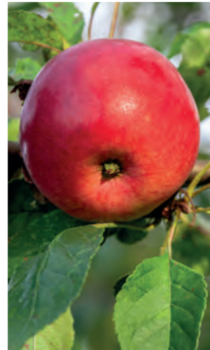
Æble Malus 'Sunrise' er en forholdsvis ny, skurv-resistent sort. Den får virkelig lækre gule æbler med røde kinder, der er både sprøde, søde og saftige.

En snedig vej til børnenes havehjerter går helt sikkert gennem maven. Derfor er det en god ide at invitere børnene på hyggestunder, hvor I sammen høster frugt og bær, der er modnet til perfektion i haven, og derefter går i køkkenet for at bage, koge saft og sylte. Inden I velfortjent kan læne jer tilbage og nyde resultatet af jeres fælles indsats. Mums.