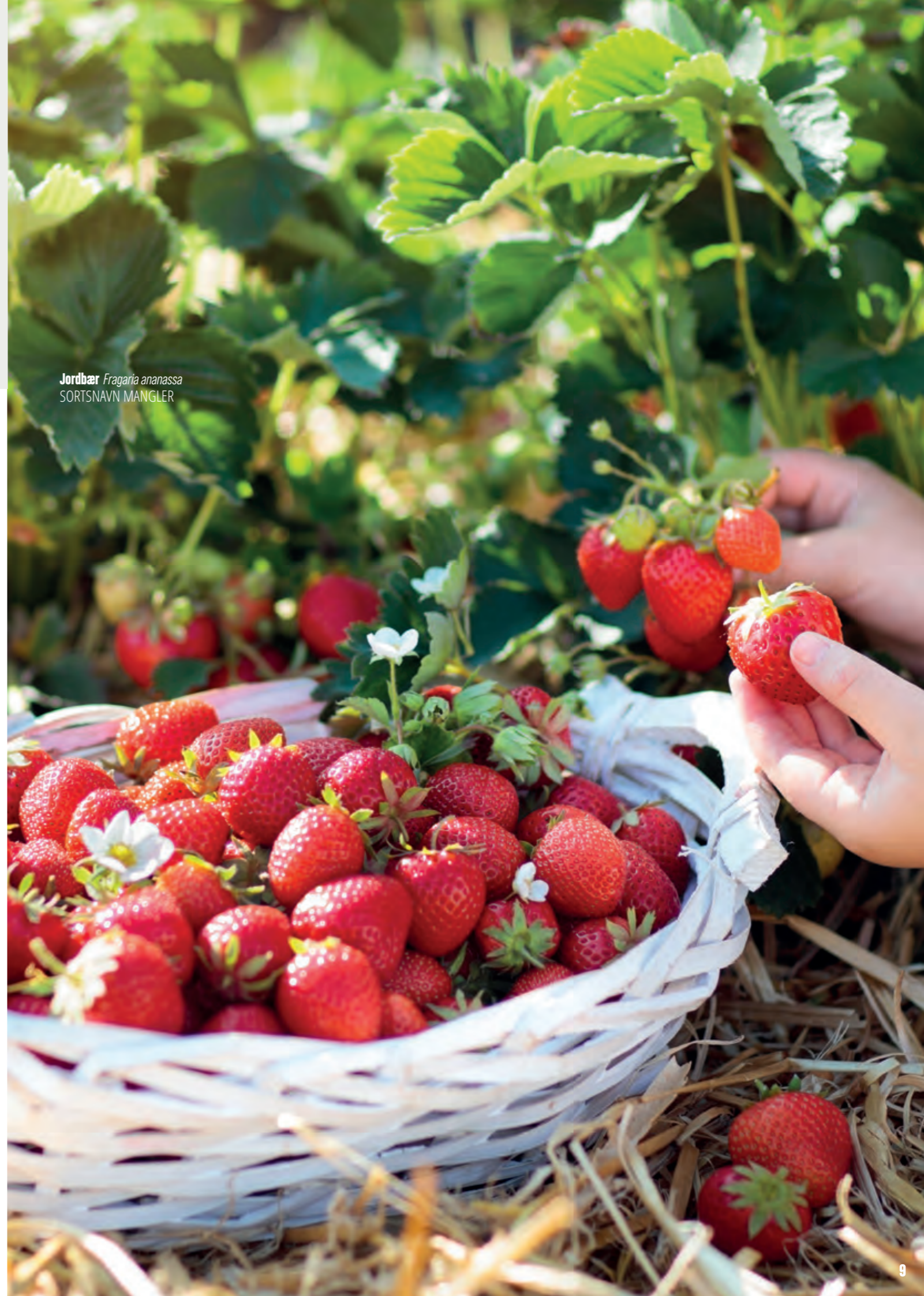
Jordbær Fragaria ananassa SORTSNAV N MANGLER