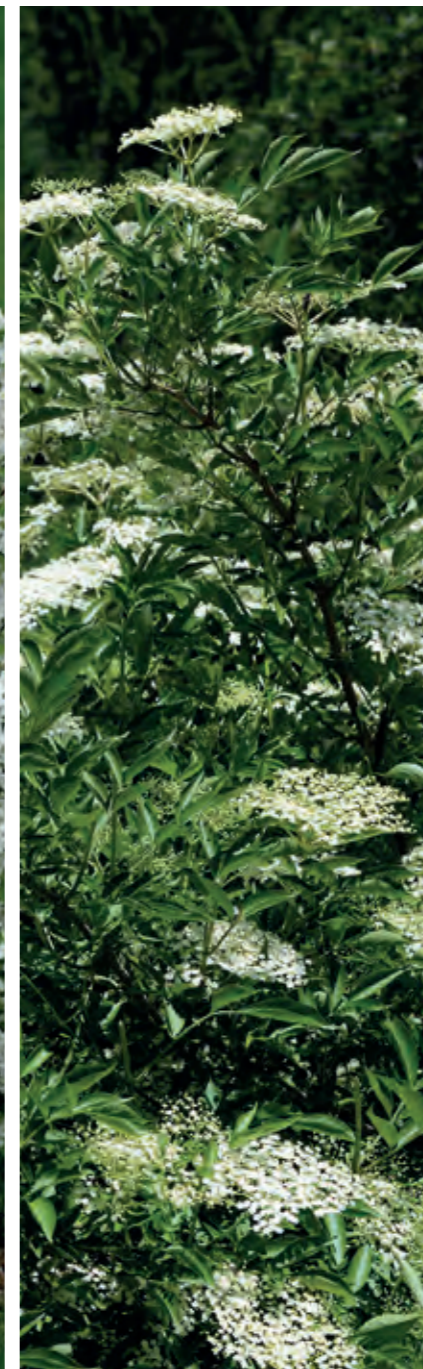
Hyld Sambucus nigra 'Sampo' er en stærk og altid pålidelig busk, der blomstrer i juni med store, velduftende hvide blomsterskærme, der siden udvikler et væld af klaser af store, lækre, næsten sorte bær.