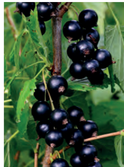
Solbær Ribes nigrum 'Lowberry' 'Little Black Sugar' er en ny sort, der udmærker sig ved sin lave, men tætte vækst, der gør pladsbehovet begrænset. Mellemstore søde og saftige bær allerede i juli.